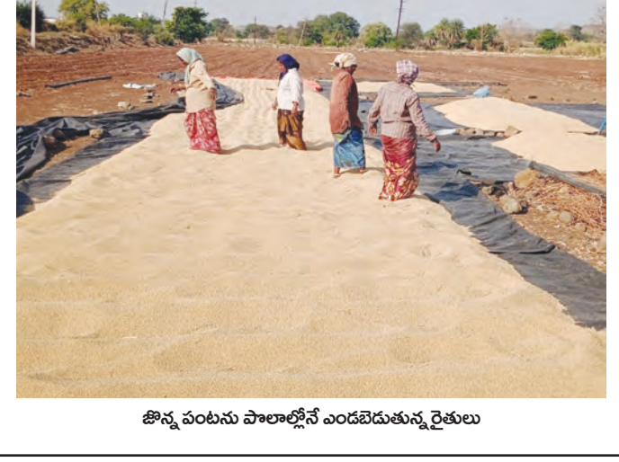
జొన్న పంటను పాలాల్లోనే ఎండబెడుతున్న రైతులు

కొనుగోలు కేంద్రాలు లేక జొన్న రైతుల అగచాట్లు దిగుబడిని కల్లల్లో ఆరబెట్టుకుంటున్నామని ఆవేదన అకాల వర్షం భయంతో పైవేటి వ్యాపారులకు అమ్ముకుంటున్నామని వెల్లడి మద్దతు ధరలో కోతలు పెడుతున్నారని ఆందోళన జొన్న కొనుగోలు కేంద్రం ఏర్పాటుచేయాలని విజ్ఞప్తి