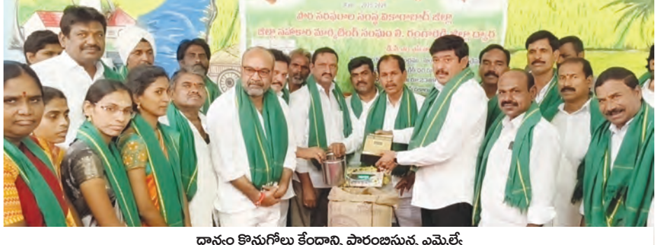
ధాన్యం కొనుగోలు కేంద్రాన్ని ప్రారంభిస్తున్న ఎమ్మెల్యే